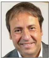
Por GUILLERMO OLIVETTO *

La sociedad vive y gasta a corto plazo. A la hora de votar, gana la "economía de la calle".